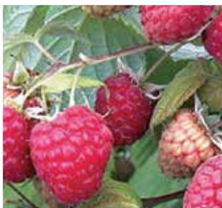
Niniane® rubaca (s)